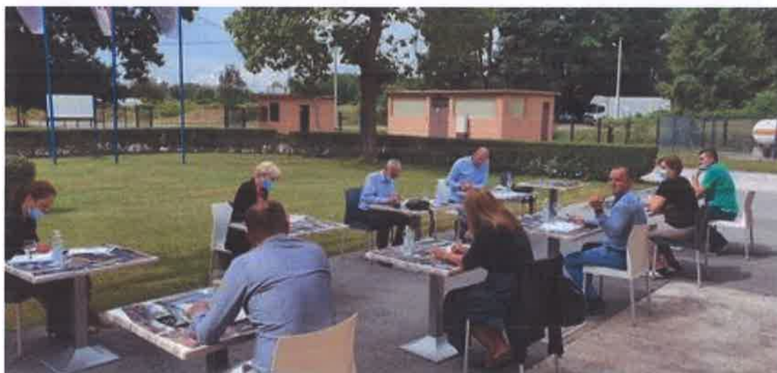
Sjednica Upravnog vijeća u vrijeme pandemije COVID-19 u proširenom sazivu na otvorenom

Oprez, ozbiljnost, odmjerjenost i postupanje na temelju struke i stručnog znanstvenog promišljanja te dosadašnjeg iskustva, ali i provedba dobro uhodanih integriranih preventivnih postupaka i kontrolnih točaka u svakodnevnicu Ustanove koji proizlaze iz našeg sustava upravljanja kvalitetom i sigurnošću – bio je prioritet i temelj rada u izvanrednim i vrlo teškim okolnostima tijekom 2022.